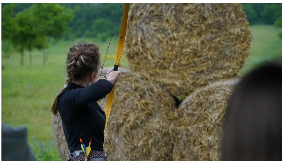
Мастер класс стрельбы из лука.